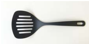
ナイロン ワイドターナー (31.5cm)