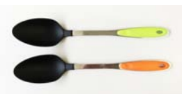
ターナー Spoon (33.5cm)