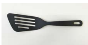
ナイロン バタービーター (31cm)