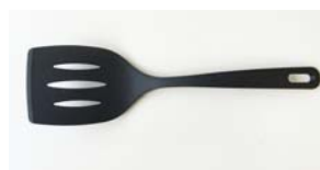
ナイロンターナー (31.5cm)