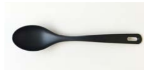
ナイロン ターナー Spoon (31cm)